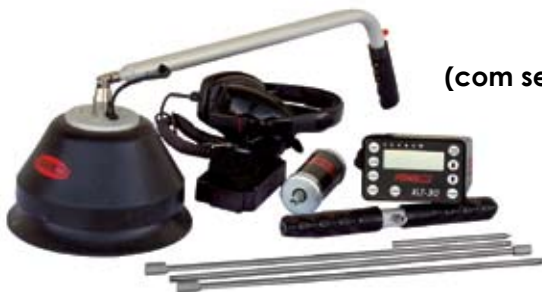
OPÇÃO A (com sensor de base grande)