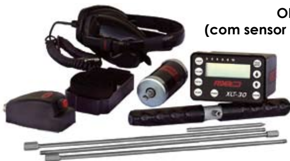
OPÇÃO C (com sensor de base pequena)