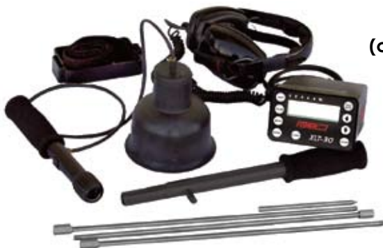
OPÇÃO B (com multi-sensor)